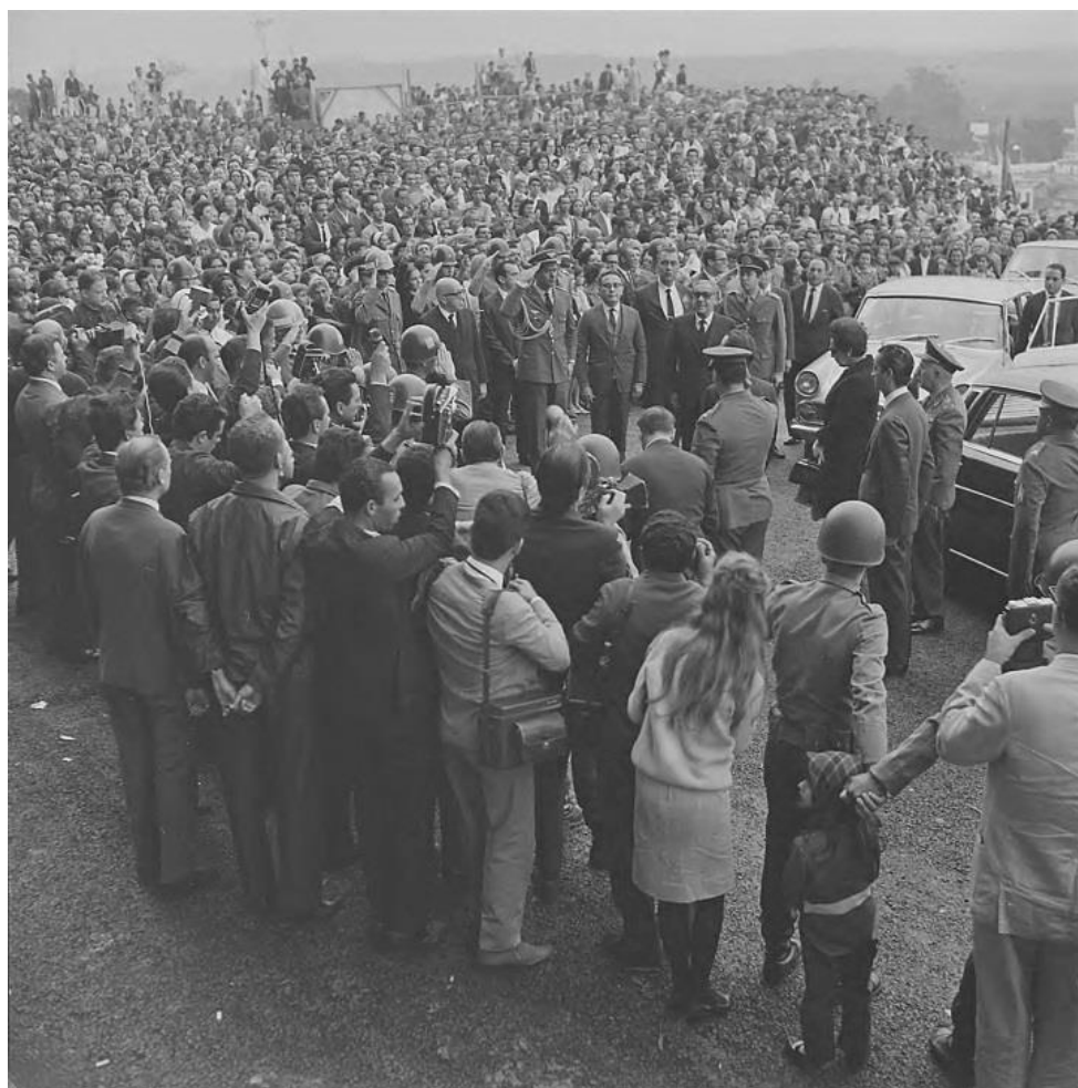
Figura 5 - Costa e Silva chega ao Santuário Nacional (1967)