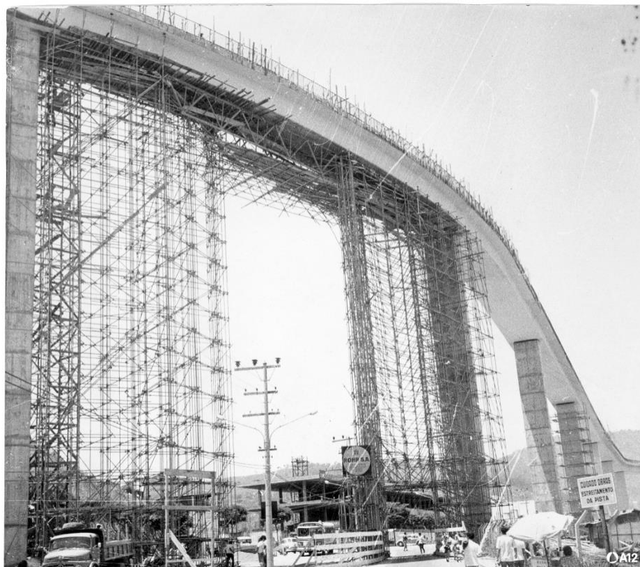
Figura 8 - Construção da Passarela da Fé (1971)