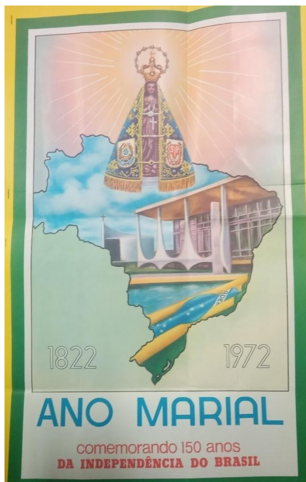
Figura 12 - Cartaz de divulgação do Ano Marial (1972)