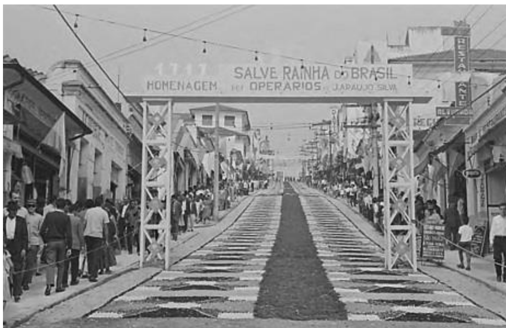
Figura 4 – A cidade de Aparecida enfeitada para a entrega da Rosa de Ouro (1967)