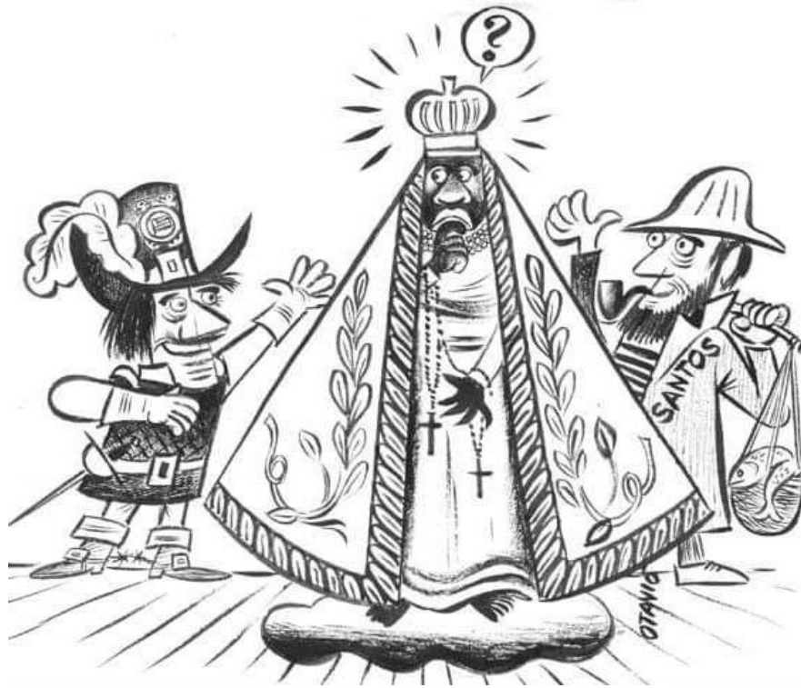
Figura 1 - Charge de Otávio no jornal Última Hora (27 de agosto de 1963)