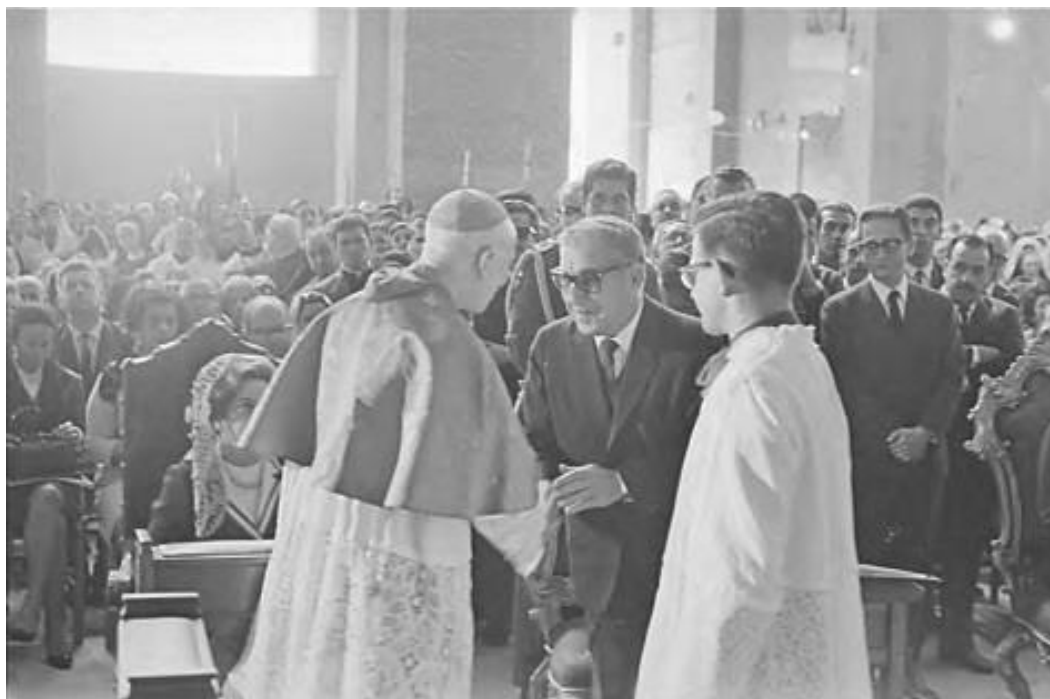
Figura 7 – Dom Motta cumprimenta Costa e Silva em Aparecida (1967)