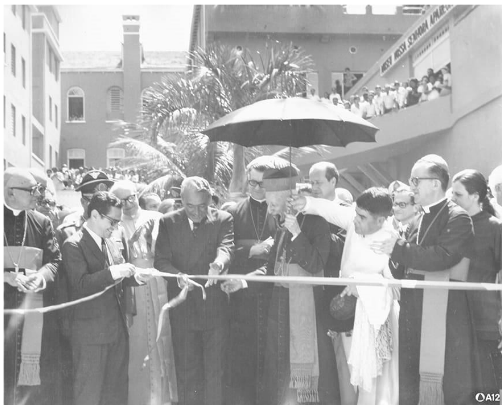
Figura 10 - Inauguração da Passarela da Fé (19 de dezembro de 1971)